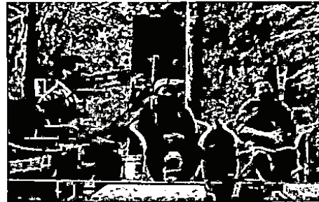
ผู้นำของศาสนา 3 ศาสนาการร่วมประชุมหารือกันเพื่อให้เกิดความสุขในสังคม

เพื่อนร่วมชาติเป็นพี่น้องกันเอง ทุกคนมีศาสนา แม้จะแตกต่างกัน แต่ก็ยังมีหลักการเดียวกัน คือทุกศาสนาสอนให้ตนเป็นคนดีมีน้ำใจ มีเมตตา ช่วยเหลือเกื้อกูลกัน ไม่วิวาทบาดหมางกัน ประกอบอาชีพสุจริตเพื่อสร้างตน สร้างสังคม และประเทศชาติให้มั่นคง ทุกคนมีความจงรักภักดีในพระมหากษัตริย์แม้จะเป็นชาวพุทธแต่ก็ทรงเป็นองค์